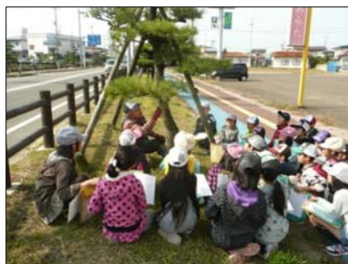
黒松友会の活動（国道7号）

そのため、今後も植樹祭を継続するとともに、「花や苗木の無料配布」や「緑化イベントの開催」等について検討し、緑に対する市民等の意識の高揚を図ります。