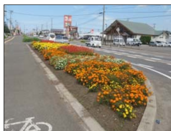
国道 7 号の花壇