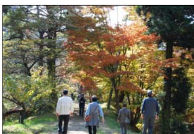
きみまち阪県立自然公園

そのため、現在指定されている鳥獣保護区の継続を図るとともに、能代市環境基本計画に基づき、次世代に引き継ぐための現地調査や啓発活動などを推進します。